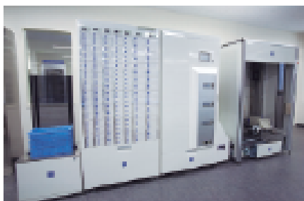
自動注射剤ピッキングマシン