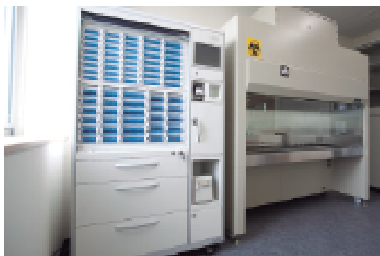
模擬抗がん剤調剤室