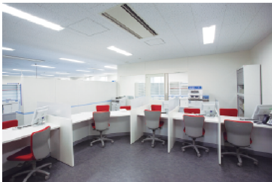
模擬院外調剤薬局

東北・北海道地区で、医学部・歯学部との合同教育が行える薬学部は国立大学をのぞけば岩手医科大学だけ。東北地区では、興味深い存在になりそうだ。